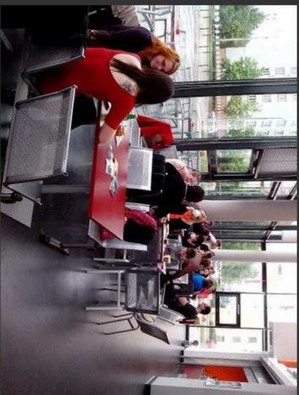
Sobotní fairtradová snídaně.